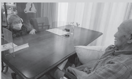
第二鹿寿苑の面会の様子

※来苑時は、マスクの着用をお願いしております。また、体調がすぐれない方は面会やお手続きをお断りさせていただくことがあります。