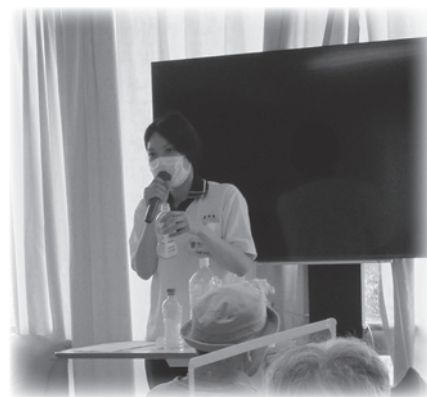
S・S管理栄養士 (平成 30 年採用)

これからも、利用者様に生活の中で楽しんでいただける食事を提供できるよう学び、成長していきたいです。