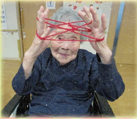
指と頭の体操としてあやとりをしました。職員と共に小さい頃を懐かしみながらしました。