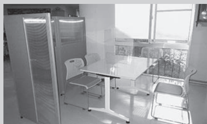
特養の面談コーナー