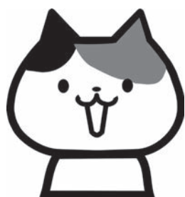
N・Y介護員 (平成 29 年採用)

町外から通勤していますが、立地的に鹿寿苑は通いやすいです。(駐車場が広く止めやすそうでした。笑)