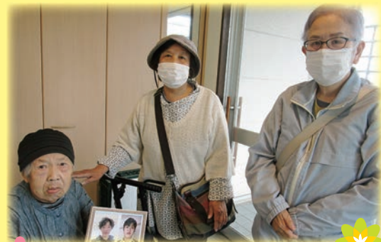
面会再開しました