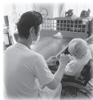
N・F介護主任 (平成 28 年採用)

色々な仕事を経験し悩んだ日々。「自分は何がしたいんだ」「したい仕事は何なんだ」「夢は…」と悩んだ 20 代。結局答えがでないまま早や数年経ち、自身に「何ならできる」と問いかけました。「おじいちゃん、おばあちゃんと話すのは好きだ」と飛び込んだのが福祉の仕事でした。笑顔あふれる環境目指し、早や 20 年の月日が経ちました。一時は福祉の仕事から離れようと思った日々もありましたが、縁あり特別養護老人ホーム鹿寿苑に採用されました。素敵な先輩方に囲まれ日々努力。現在は第二鹿寿苑で(ユニットケア)と出会い、入居者様の(暮らしの継続)、そして(今後の暮らし)を共に考え、入居者様の暮らしの支えになれるよう日々奮闘。悩んだ日々、無駄じゃなかったと感じています。チームの働く力を最大限に発揮できるようこれからも努力していきます。