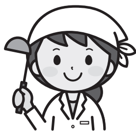
N・Y調理員 (平成 29 年採用)

今回は鹿寿苑で働いている職員の声をご紹介します。 どんな職場なの?どんな人が働いているの?など気になる方はぜひチェックしてみてください。