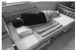
②シートを折りたたんで背中の中後ろにセットします