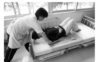
④介助者は利用者の腰部または臀部に手を添えて動かします