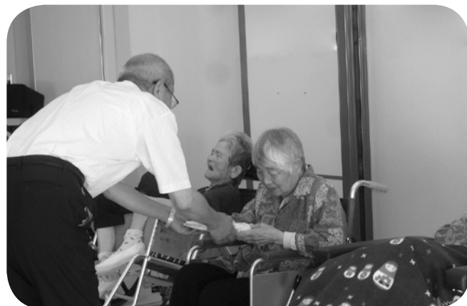
施設長から、お祝い品の贈呈