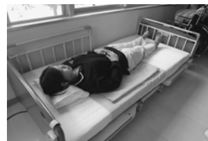
③利用者に仰臥位に戻ってもらいます。シートを引き出します