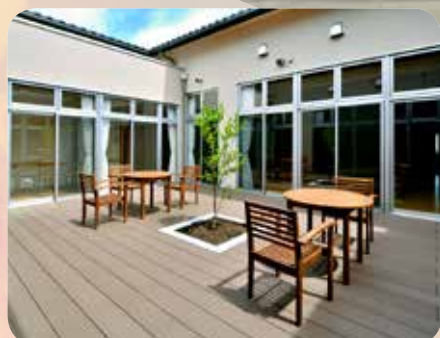
光が降り注ぐ中庭