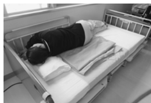
②シートを折りたたんで背中の中後ろにセットします