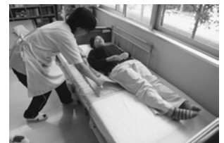
④介助者は利用者の肩と腰に手を当てて動かします