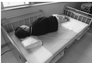
①利用者に側臥位になってもらいます