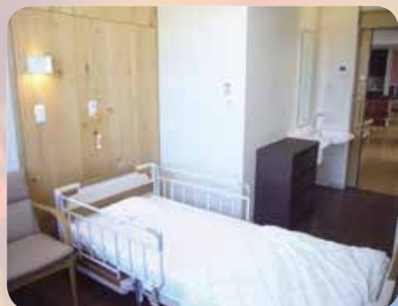
明るく木のぬくもりのある居室