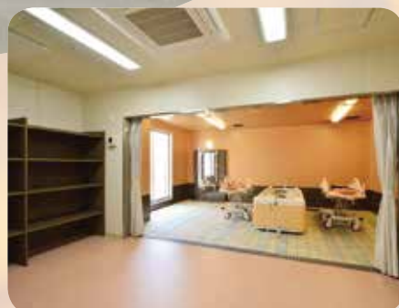
寝たまま入浴できる特殊浴槽