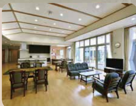
リビング兼食堂（ゆり）