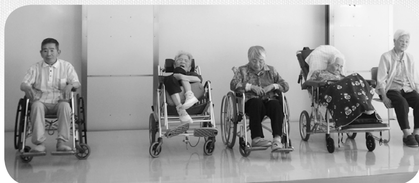
百寿，白寿，米寿になられた皆様です