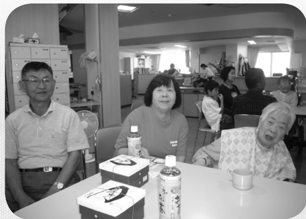
ご家族と一緒に会食