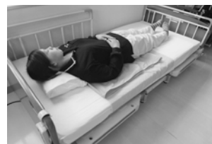
③利用者に仰臥位に戻ってもらいます。シートを引き出します